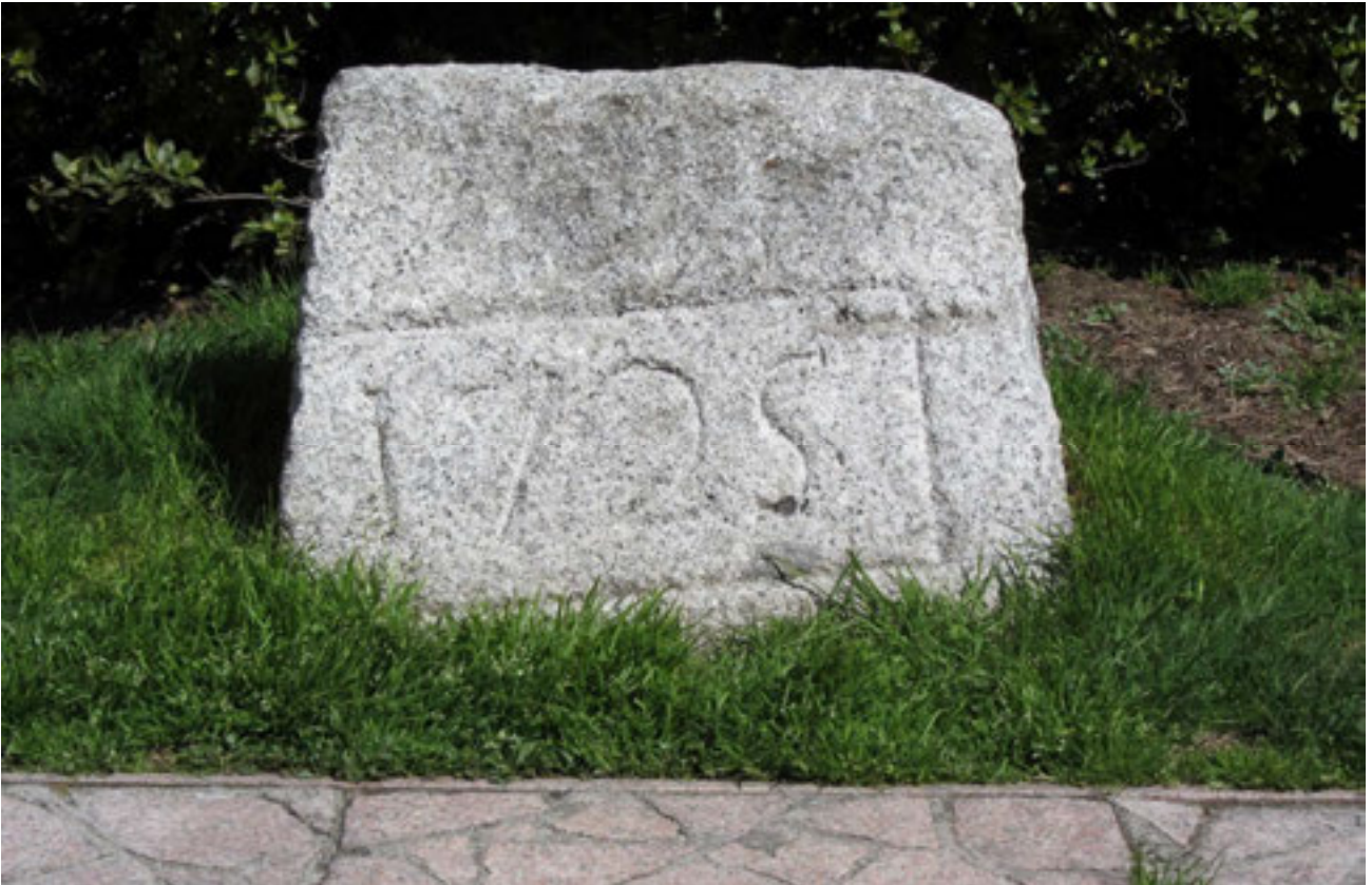
Cappello in pietra appartenente all'antico Ponte della Lanca.