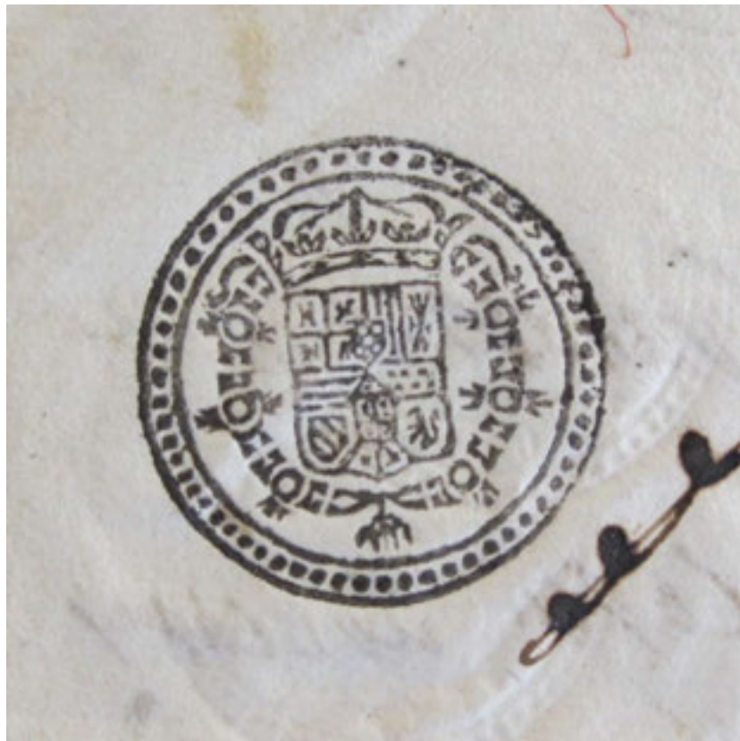
Sigillo di Carlo II Asburgo Spagna presente nell'atto del 3 marzo 1712.