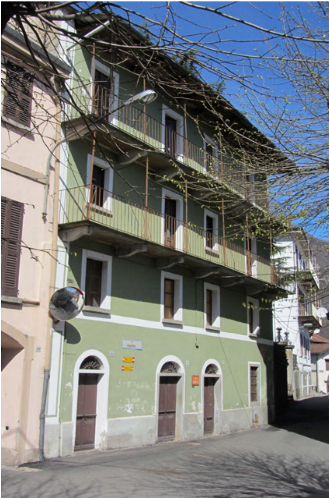
2013, scorcio della Dogana Ducale, 1738-1743.