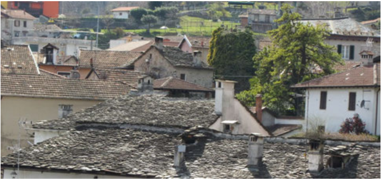
Scorcio del tetto della Casa Parrocchiale di Casale Corte Cerro (Aprile 2013).

L'attuale posa delle piode in beola è ancora quella operata dal De Filippi di Rimella nel 1727.