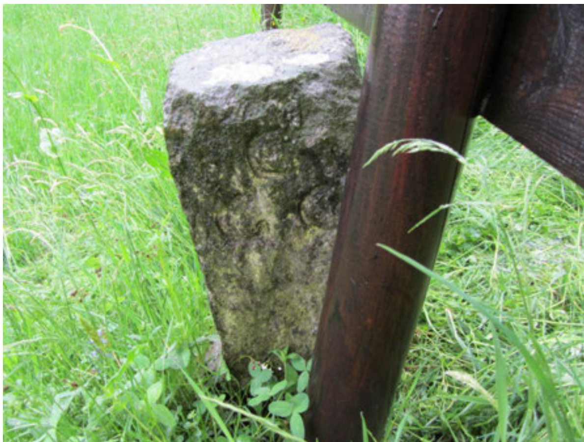
Confine tra Casale Corte Cerro e Buglio risalente al 1722; termine n° 6, lato recante la lettera B. Attualmente sito in Tanchello - località Pradon.