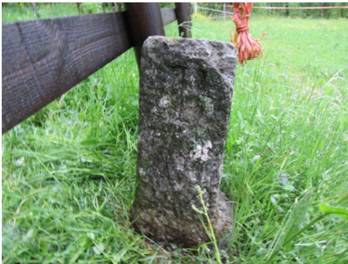
Confine tra Casale Corte Cerro e Buglio risalente al 1722; termine n° 6, lato recante le lettere CCC. Attualmente sito in Tanchello - località Pradon.